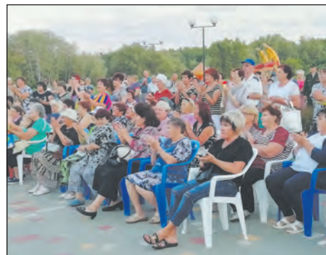
■ Выступления артистов зрители встречали и провожали аплодисментами