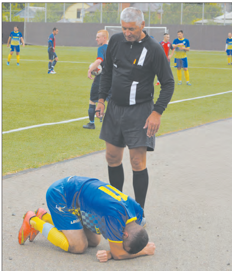
Были и досадные моменты