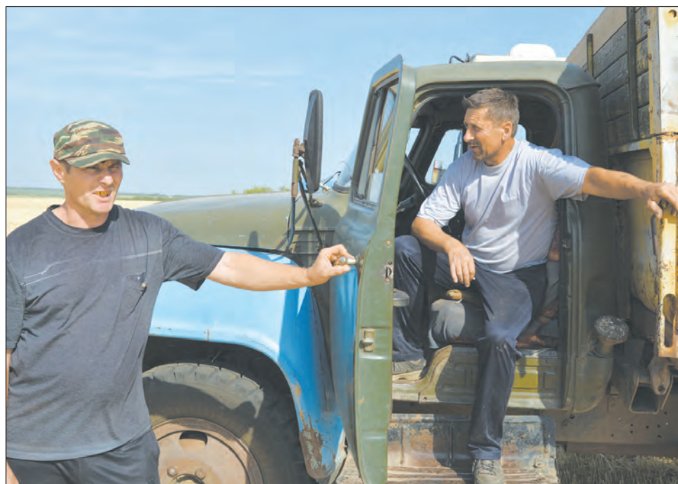
В ожидании очередной загрузки зерна нового урожая

По данным Управления сельского хозяйства, на начало текущей недели из плановых 38 тыс.га озимая пшеница убрана на 11 тыс.га. Предварительная урожайность составляет 28 ц/га, на хранение отправлено почти 30 тыс. тонн зерна нового урожая. В пиковые часы уборочных работ в поле находятся одновременно более 140 зерноуборочных комбайнов. Материальная база сельскохозяйственной техники позволяет успешно вести жатву без привлечения комбайнов из-за пределов района.