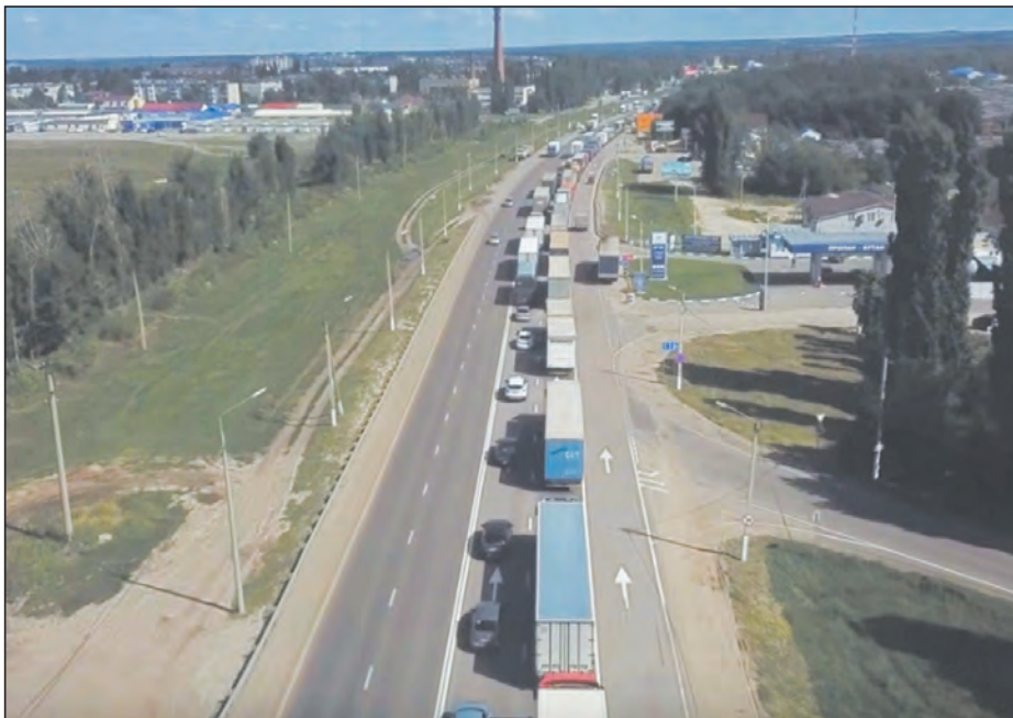
■ Пробка на трассе М-4 «Дон»

Чтобы избежать заторов в 2019-м, власти решили ограничить движение грузовиков по участку трассы М-4 «Дон» у Лосево (км 589 — км 741). С 24 мая до 15 сентября 2019 года фурам запретили ездить по федеральным трассам с 8.00