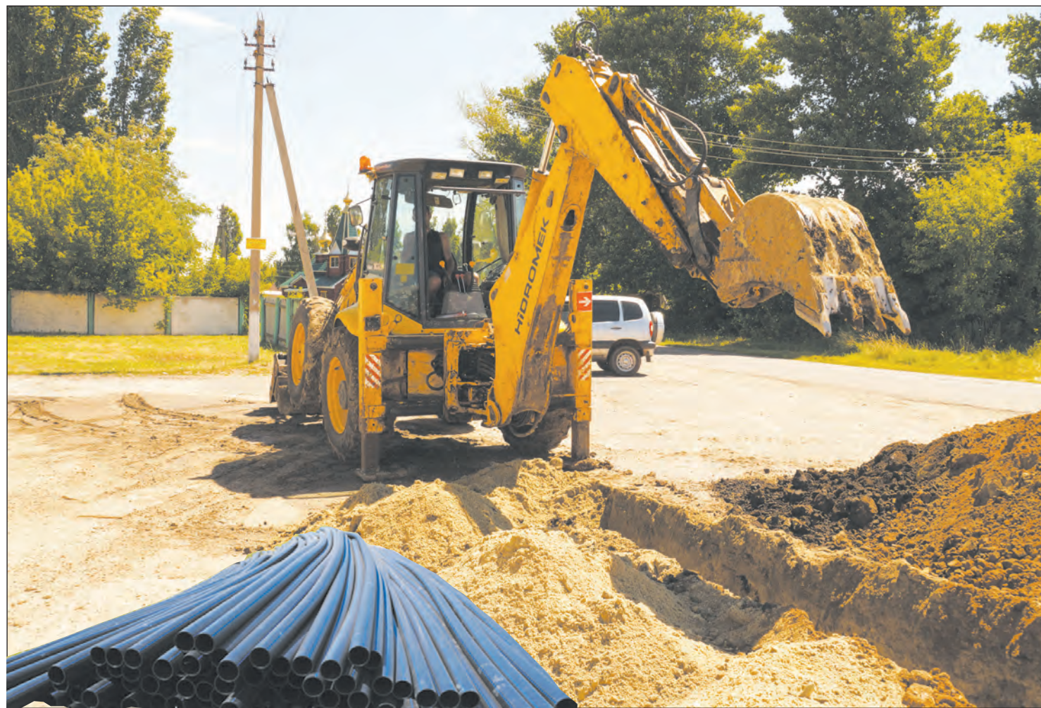
Работы планируется завершить к 15 ноября

Село вошло в областную программу «Чистая вода»