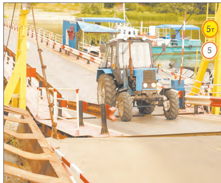
■ В районе Галиевки Богучарского района понтоны уже опустили

– Если по мосту будут ездить грузовики, всю эту конструкцию может раздавить об дно, она разведется по швам. Три года назад у нас был такой инцидент. Затонуло два понтона моста, который соединяет Богучар и Петропавловку. На мост заехали два самосвала с прицепами, которые объезжали Лосево, два понтона заполнились водой, и вся цепь не поднялась. Нам пришлось демонтировать конструк-