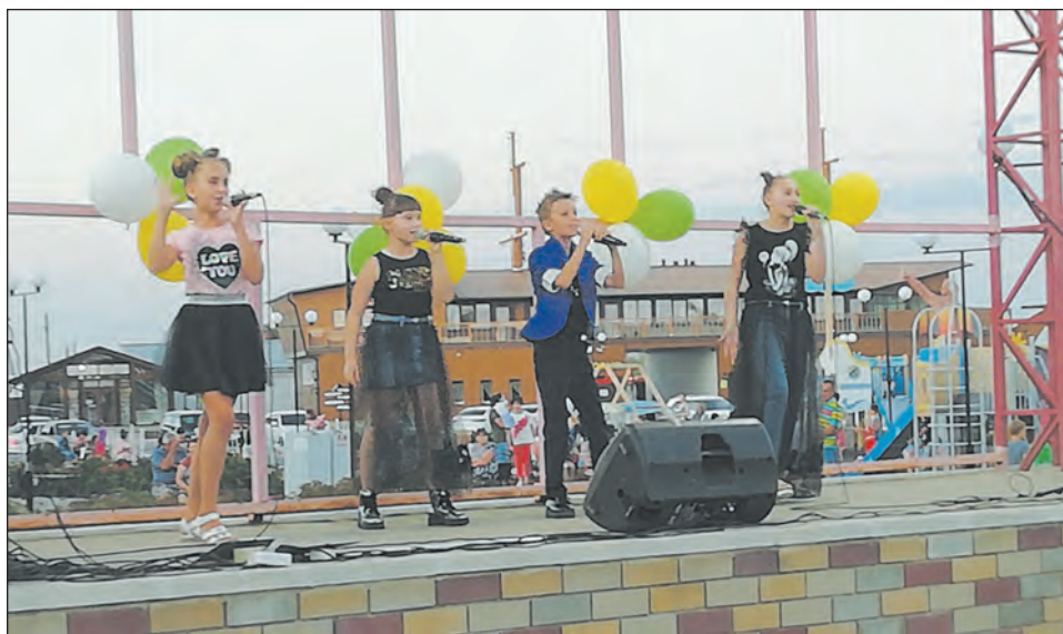
■ На сцене – детский ансамбль «Радуга»